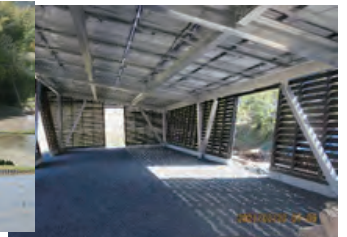
ア.ウン.パヴィリオン(内部)