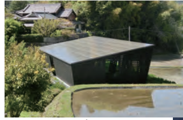
ア.ウン.パヴィリオン (屋根に太陽光パネル)