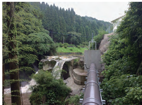
取水設備、道水管と滝の様子