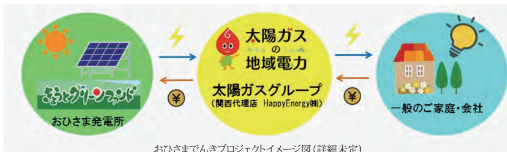
おひさまでんきプロジェクトイメージ図（詳細未定）