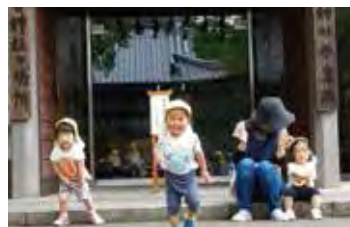
今日は、向日神社までお散歩。