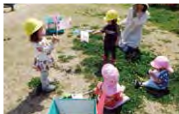
近くの公園でたくさん遊びます。