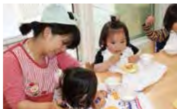
給食やおやつは自園で調理しています。