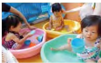
1階のテラスでのプール遊び。気持ちいいね～!