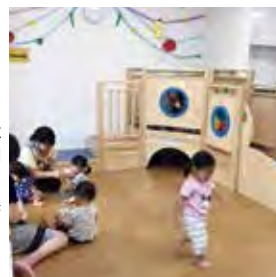
2階は、子育てひろばとして、地域の親子に開放しています。安全で楽しい、ドイツ製の遊具が自慢です!