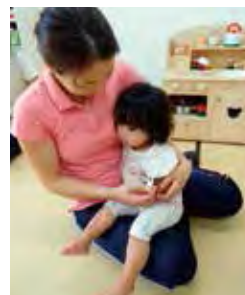
看護師が毎朝、健康チェックしています。