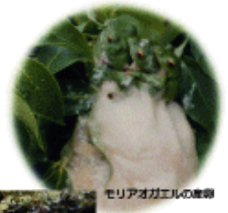
メリアオガエルの産卵