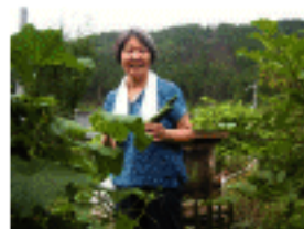
パーマカルチャーとは自然の生態系のシステムにならった持続可能な農的暮らしの設計手法。環境にも人にも優しい生活の知恵がいっぱいです。

アースガーデンは、かやぶき民家と清流の里、京都府南丹市美山町にあります。地元産木材を使った建物、年間150種類の食べ物ができる有機ガーデン、雨水タンクや薪ストーブ、水やゴミの循環、自然エネルギーの活用など、持続可能な暮らし方の事例となる施設をめざしています。全体の設計にパーマカルチャーデザインを取り入れています。有機ガーデンや地元産の食材で自然派カフェを開くほか、環境にできるだけ負荷をかけない暮らしを工夫し、その知恵を分かち合いたいとスタディーツアーを実施しています。