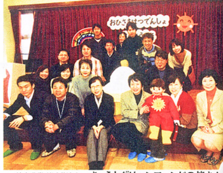
特定非営利活動法人 きょうとグリーンファンドの皆さん